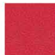
Vermillion red (P-200)